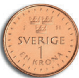
1-krono paluni rig