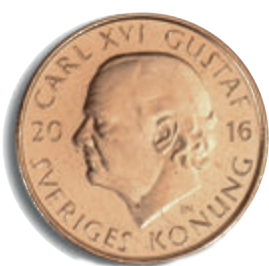
1-krono angluni rig

Le neve xurde naj len nickelo thaj mai činore thaj vušoro avena de sar le xurde love kai si akana.