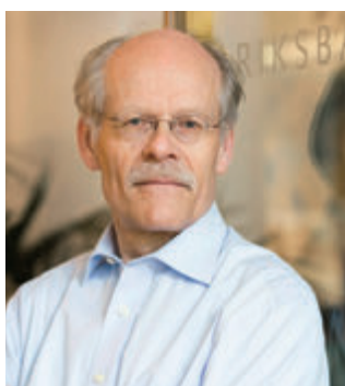
Stefan Ingves O baro po Riksbanko Septembro 2016

De tu gindo ke šai avel pares le levčenge thaj le bankonge te primin but xurde, so mai but akana kai pašol e vriama le parujimaski. Trubul te keres kado de vriama.