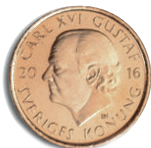
2-kronongo angluni rig