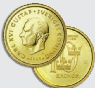
10-kronongi sa jekh fialo avela či avela parudi.