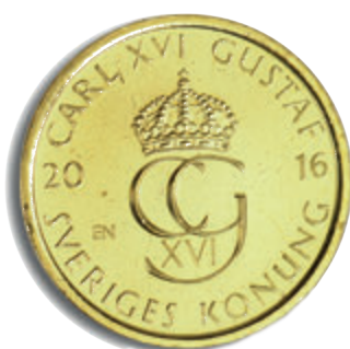
5-Panžengi angluni rig