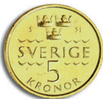
5- Panžengi paluni rig