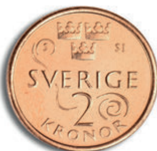
2-kronongo paluni rig