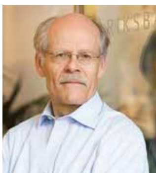
Stefan Ingves Riksbank 银行行长 2016 年 9 月

请注意，商店和银行接受硬币的数额可能存在限制，尤其是在新旧更替的最后阶段。旧币请勿保留太久。