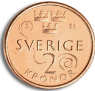
2 كرونا الظهر