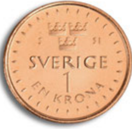
1 كرونا الظهر

قطع النقد الجديدة خالية من النيكل وأخف وزناً وأصغر حجماً من قطع النقد الحالية.