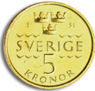
5 كرونا الظهر