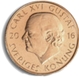
1 كرونا الوجه