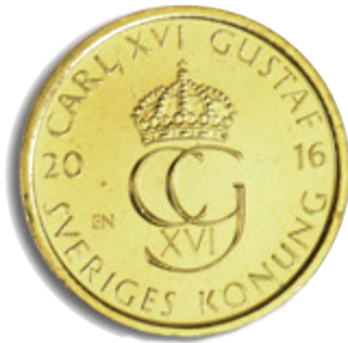
5 كرونا الوجه