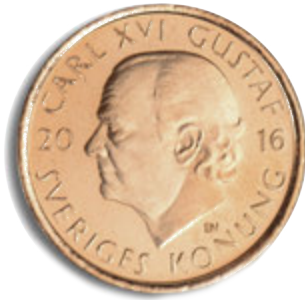
2 كرونا الوجه