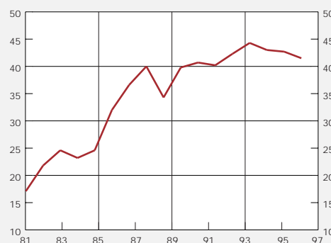
Diagram R14. Livsmedelsindustrins driftöverskott, brutto, som andel av förädlingsvärde till faktorpris. Procent

Jordbrukskooperationen dominerar med cirka 45 procent av livsmedelsindustrins totala produktion i Sverige. Koncentrationen är speciellt hög inom vissa branscher. Områden som slakt och chark, mejerisektorn samt kvarnar och bagerier svarar sammantaget för omkring 60 procent av livsmedelsindustrins omsättning och antal anställda. I den största delbranschen, slakt och chark, hade Lantbrukskooperationen en marknadsandel på 78 procent 1996. Den näst största delbranschen, mejeriindustrin, dominerades av Arla och Skånemejerier, som också är lantbrukskooperativa. Vad gäller bageri- och kvarnindustrin så hade Cerealiakoncernen genom Nord Mills och Kungsörnen ca 45 procent av förmalningen.