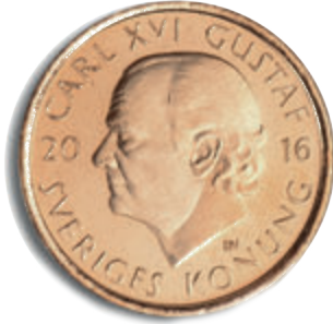
رووی 2 کرۆنی (روو)