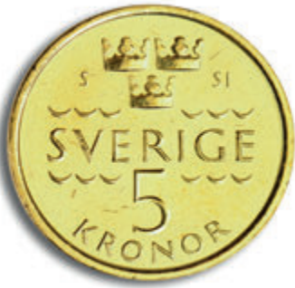
پشته وهی 5 کرۆنی (پشته وه)