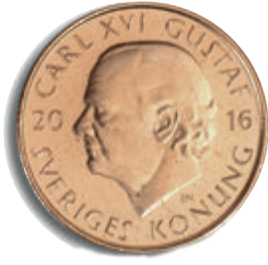
رووی 1 کرۆنی (روو)