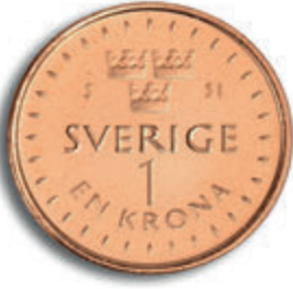
پشته وهی 1 کرۆنی (پشته وه)

له تشرینی یه کهم (ئۆکتۆبه ر) ی 2016 دا، Riksbank دهست ده کات به بلاوکردنه وهی پاره ی کانزایی 1، 2 و 5 کرۆنی نوئی. پاره ی کانزایی 10 کرۆنی هیچ گۆرانکارییه کی به سهردا نایه ت. له وانه یه تۆزیک بخایه نیت بۆ ئه وهی بتوانیت سه یری پاره کانزاییه نوئییه کان بکه یت چونکه پاره کانزاییه هه نووکه ییه کانیش بۆ ماوه یه ک له گه ردا ده بن. پاره کانزاییه نوئییه کان نیکلیان تیدا نییه، سووکتز و بچووکتز له پاره کانزاییه کانی ئیستا.