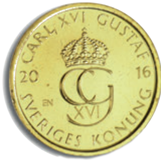
رووی 5 کرۆنی (روو)

پاره ی کانزایی 10 کرۆنی هیچ گۆرانکارییه کی به سهردا نایه ت.