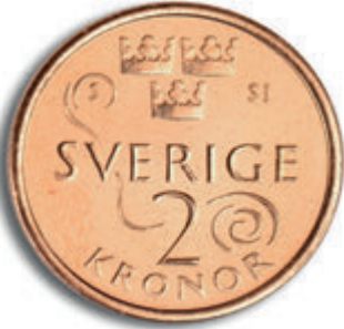
پشته وهی 2 کرۆنی (پشته وه)