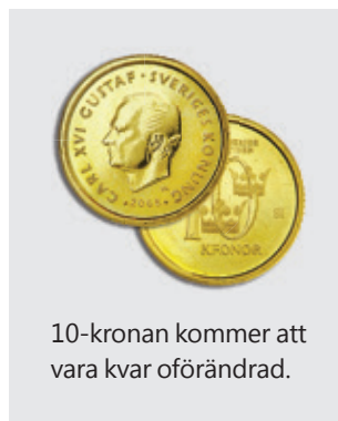
10-kronan kommer att vara kvar oförändrad.