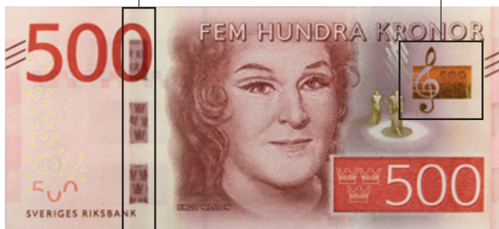
Bild som skiftar färg gradvis mellan guld och grönt när du vickar på sedeln. Bilden ankytjer till personen på sedeln och i bilden finns även sedelns valörsiffra.